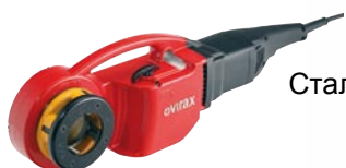
Сталь BSPT лев.