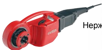
Нерж. BSPT прав.