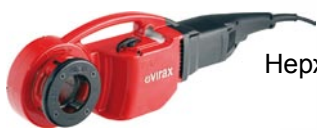
Нерж. BSPT прав.